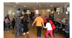
? Québec quinzaine culturelle