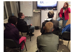
? Visite à l'auto-école