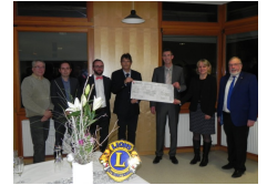
? Lions Club