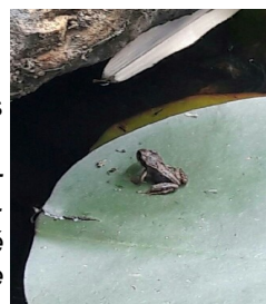
Groupe « Initiatives »