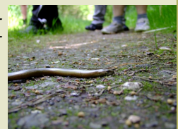
PHOTO ORVET : Les bénéficiaires de l'activité « nature » croisant le chemin d'un orvet.