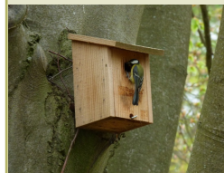
PHOTO OISEAU : Mésange charbonnière devant le nichoir situé près de l'infirmerie.