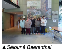
▲ Séjour à Baerenthal