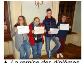
▲ La remise des diplômes