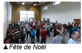
▲ Fête de Noël