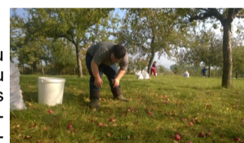
Espace Rodin Service Accueil de Jour

Le 27 septembre 2017, les bénéficiaires du SAJ ont aidé au ramassage de pommes au verger conservatoire de Froeschwiller. Dans ce verger sont cultivées des dizaines de variété différentes de pommes. Celles récoltées par les bénéficiaires ont servi à faire du jus de pommes dont une partie a été donnée au Centre de Harthouse. Les bénéficiaires n'ont pas chômé durant cette journée ensoleillée et ont ramassé pas moins de 750 kg de fruits.