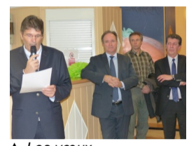
▲ Les vœux