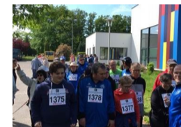
▲ Cross au Centre