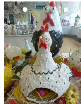
▲ Le marché de Pâques